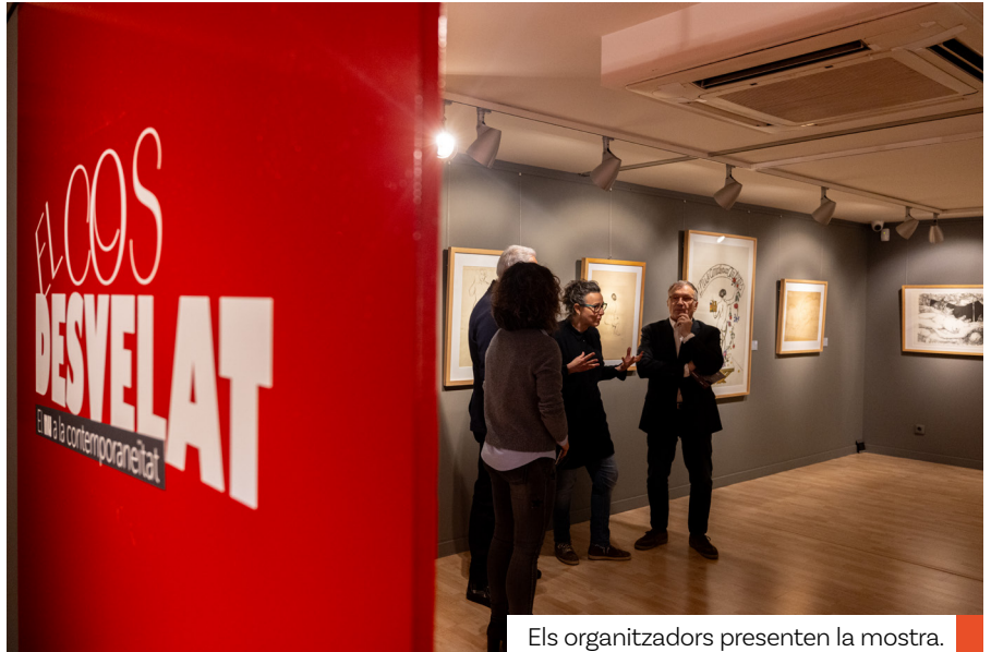
Els organitzadors presenten la mostra.