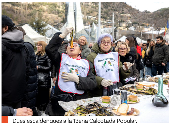
Dues escaldenques a la 13ena Calçotada Popular.