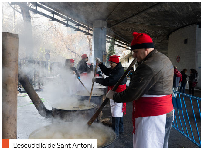
L'escudella de Sant Antoni.