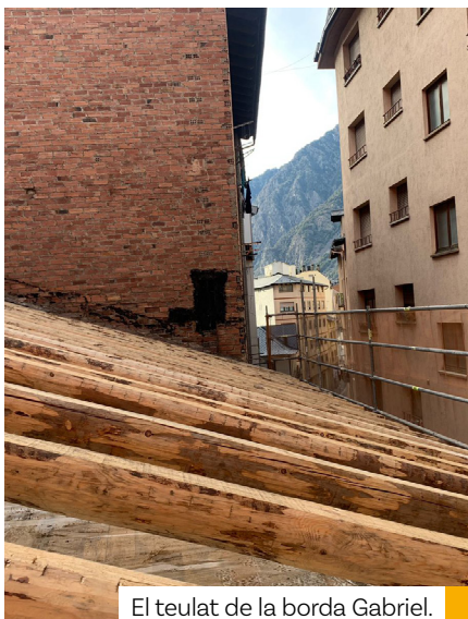
El teulat de la borda Gabriel.