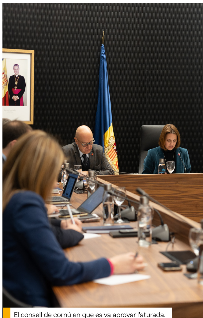
El consell de comú en que es va aprovar l'aturada.

Durant aquest període de suspensió, el Comú acabarà de treballar en els estudis de càrrega màxima que s'han demanat des del Govern i que han de permetre determinar quin creixement pot assumir la parròquia i determinar quina Escaldes-Engordany volem pels nostres fills. Un cop aquests estudis estiguin finalitzats, i en base a la informació que proporcionin, es tirarà endavant la modificació del Pla d'Ordenació i Urbanisme (POUP) de la parròquia.