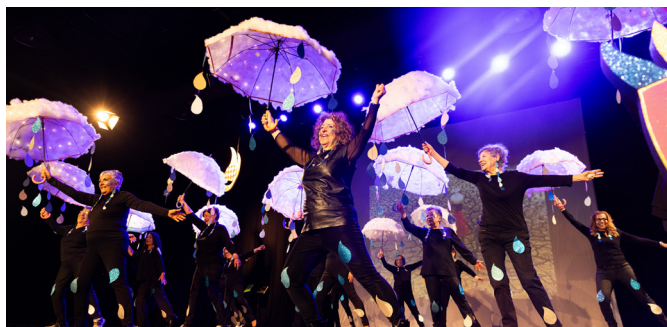
La gent gran d'Escaldes-Engordany al Carnaval Interparroquial.

Durant el primer trimestre d'enguany, Escaldes-Engordany ha estat escenari de celebracions. Els carrers de la parròquia s'han omplert de colors, música i olors gràcies a l'Escudella de Sant Antoni, que van preparar els Amics del Pont dels Escalls, i a la calçotada popular organitzada la Unió Pro-Turisme. La cavalcada dels Reis d'Orient i la rua de Carnaval han estat els altres actes festius parroquials.