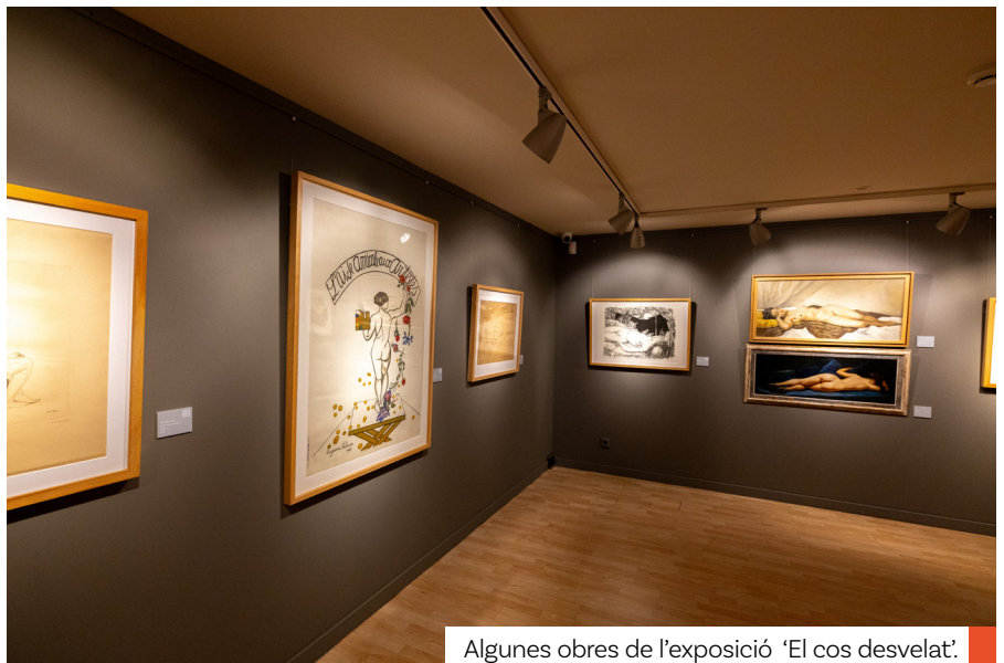
Algunes obres de l'exposició 'El cos desvelat'.