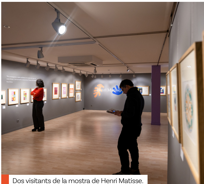
Dos visitants de la mostra de Henri Matisse.