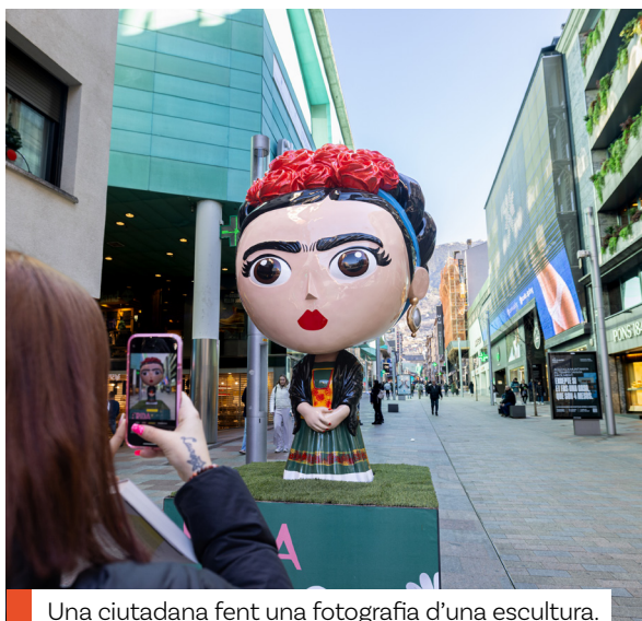
Una ciutadana fent una fotografia d'una escultura.

La programació de l'exposició d'Henry Matisse (1869 - 1954) també ha comptat amb els tallers de collage i gravat a càrrec de l'artista de casa Mònica Armengol i de l'activitat creativa de la també artista Cecília Santañés.