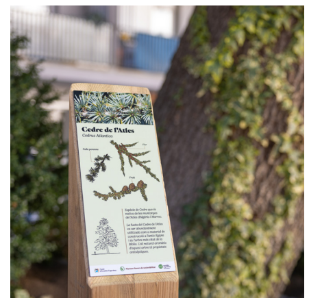
Un dels cartells del Parc de la Mola.

Aquests cartells s'aniran instal·lant en diferents zones verdes de la parròquia amb la voluntat de fer extensible la idea promoguda per un escalenc i que el Comú va recollir seguint el desig compartit de conèixer i cuidar la natura andorrana sent un país verd, de muntanya i ple d'espais naturals que cal protegir i preservar.