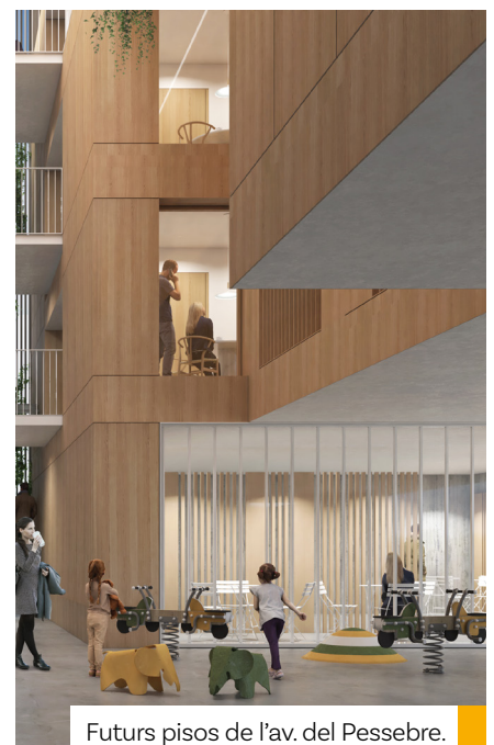
Futurs pisos de l'av. del Pessebre.

El Comú preveu que els treballs finalitzin durant la primavera. Després, serà el Govern l'encarregat de dur a terme la construcció de l'edifici, tal i com es va marcar amb el conveni signat entre les dues institucions el març de l'any passat.