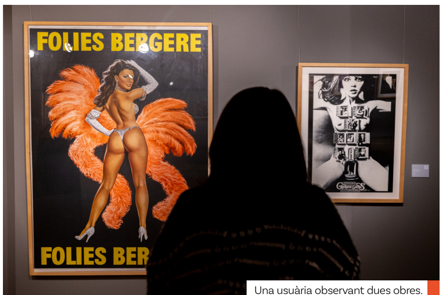
Una usuària observant dues obres.