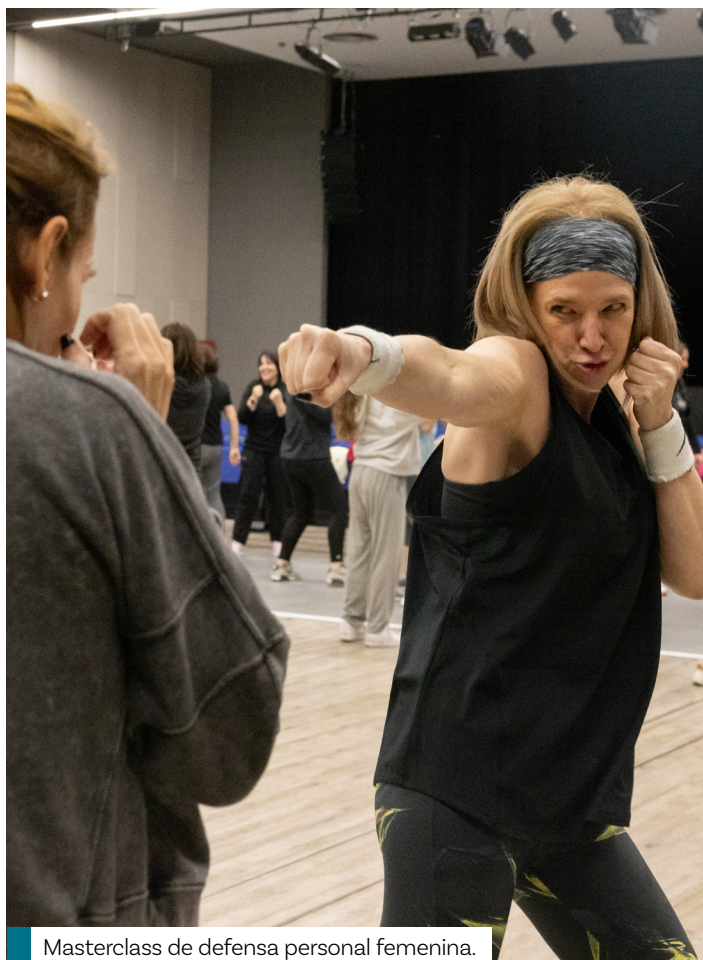
Masterclass de defensa personal femenina.