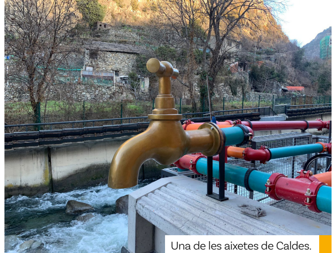
Una de les aixetes de Caldes.

D'altra banda, les obres de l'edifici Caldes estan centrades ara en els treballs d'arquitectura per reformar la part interna.