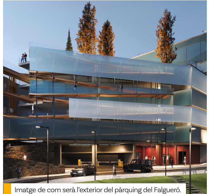
Imatge de com serà l'exterior del pàrquing del Falgueró.

La inclusió de la nova planta farà allargar dos mesos més les obres, de manera que el nou aparcament podrà ser una realitat a inicis de l'any vinent.