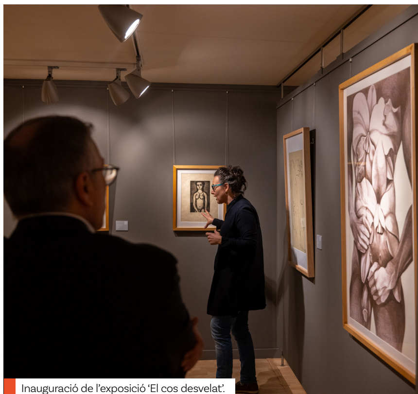
Inauguració de l'exposició 'El cos desvelat'.

Com ha evolucionat al llarg dels segles la plasmarció d'un tema clàssic com el nu en les obres d'art? Com es reflecteix al segle XX i quins misticges hi poden haver al darrere? Aquestes i d'altres preguntes són les que els espectadors poden resoldre en la mostra El cos desvelat . El nu a la contemporaneïtat , que acull el Centre d'Art d'Escaldes-Engordany (CAEE) fins al 15 de juny. Es tracta d'un recorregut artístic pel segle XX en què es poden veure diferents interpretacions del cos humà en aquest període, des de la seva expressió com a bellesa natural, al cos desconstruït o el nu com a mercaderia. L'exposició permet als visitants retrobar-se amb obres icòniques de l'art modern i contemporani, imatges "molt conegudes que li resultaran molt familiars com l'Olympia de Manet". En total, una seixantena d'obres de la col·lecció privada José Luis Rupérez entre les quals litografies, serigrafies o gravats. El col·leccionista es mostra molt satisfet