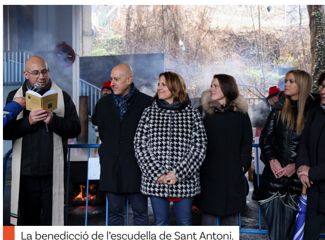
La benedició de l'escudella de Sant Antoni.