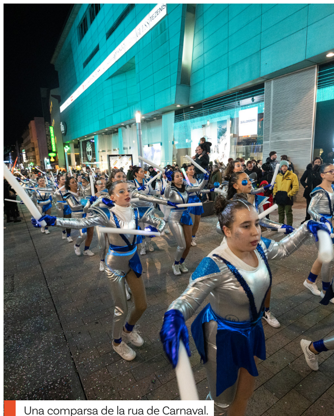
Una comparsa de la rua de Carnaval.