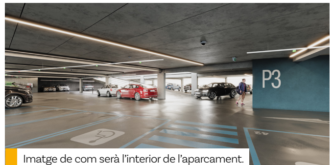
Imatge de com serà l'interior de l'aparcament.