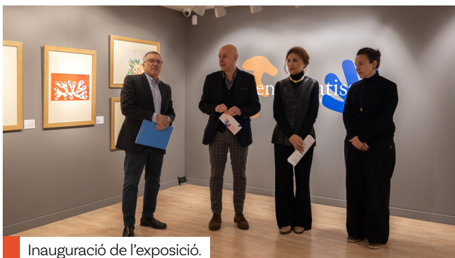
Inauguració de l'exposició.

Abans d'acollir la nova exposició temporal, el CAEE tanca la mostra dedicada al pintor, escultor, dibuixant i gravador Henri Matisse rebent un total de 4.728 visitants repartits entre els tres mesos que ha estat activa. Una xifra que s'ha repartit de la següent manera: desembre, 900 visitants; gener, 1.324 visitants; febrer, 2.201 visitants i 1 i 2 de març, 303 visitants. Una de les dades destacades ha estat l'interès que ha despertat l'obra de Matisse entre el públic andorrà que ha suposat el 69% del total de visitants.