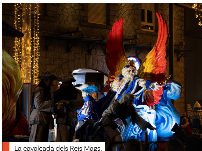
La cavalcada dels Reis Mags.