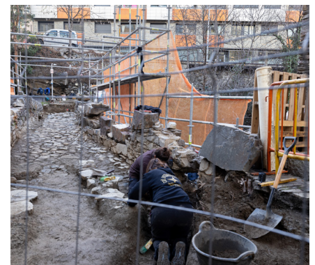
Operàries fent els treballs arqueològics.

pedra antics que han permès obtenir informació històrica del monument. L'objectiu del procés d'embelliment dels tres ponts històrics passa per conservar el patrimoni cultural i potenciar el turisme cap aquests indrets. El Comú també impulsarà els treballs d'il·luminació dels tres ponts.