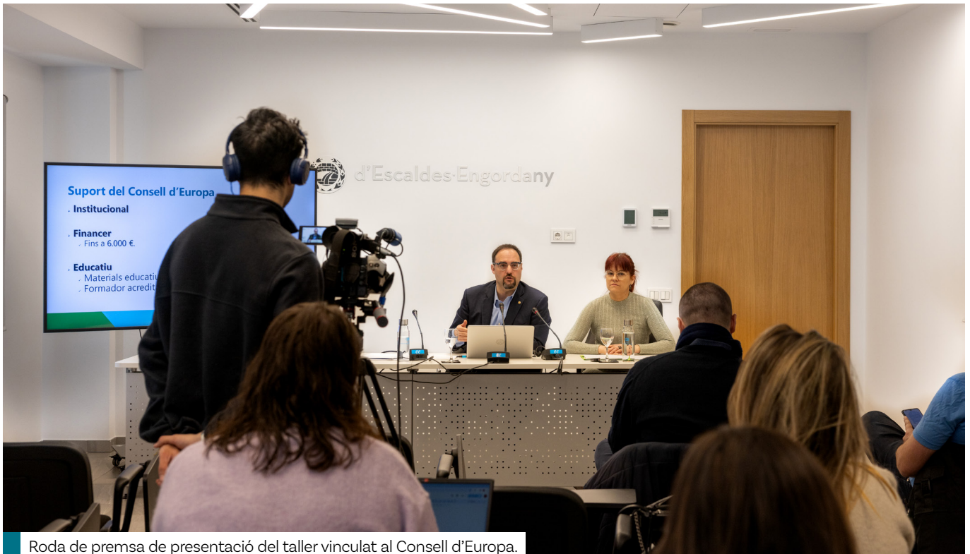
Roda de premsa de presentació del taller vinculat al Consell d'Europa.