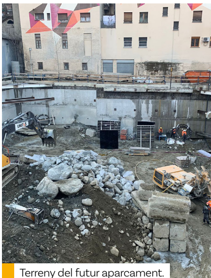
Terreny del futur aparcament.